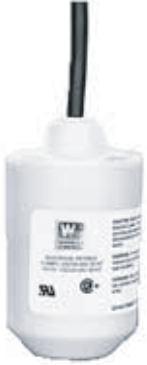
M 系列电缆浮球式 液位开关